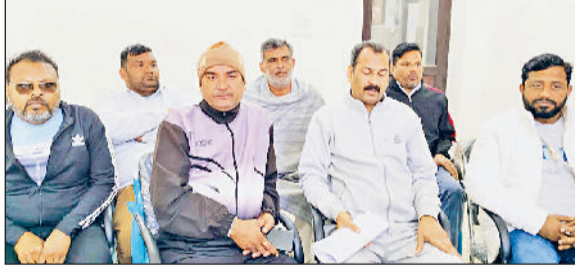
खरखोड़ा। विकास कार्य न कराए जाने पर रोष प्रकट करती पार्षद