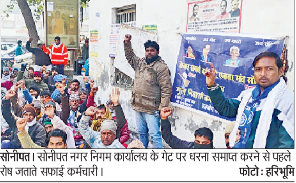
सोनीपत। सोनीपत नगर निगम कार्यालय के गेट पर धरना समाप्त करने से पहले रोष जताते सफाई कर्मचारी।

हरिभूमि न्यूज ▶ सोनीपत सोनीपत नगर निगम के गेट पर ठेका सफाई एकता मंच संबंधित मूल निवासी कर्मचारी कल्याण महासंघ, बलि सेना यूनिटन ने वीरवार को धरना प्रदर्शन समाप्त