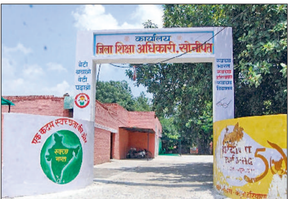
सोनीपत। सोनीपत के सेक्टर-14 स्थित जिला शिक्षा विभाग का कार्यालय।

निशुल्क एवं अनिवार्य बाल शिक्षा अधिकार अधिनियम (आरटीई) के तहत सीटें घोषित नहीं करने वाले मान्यता प्राप्त 35 निजी स्कूलों ने जुर्माना भरकर विभाग को सरेडर कर दिया है। वहीं 30 निजी स्कूल जुर्माना राशि भरने में अभी भी देरी कर रहे हैं। विभाग ने ऐसे स्कूलों को खंड शिक्षा अधिकारियों से दोबारा नोटिस जारी करने के निर्देश दिए हैं, ताकि जुर्माना राशि को जल्द जमा करवाया जा सके। इससे पहले विभाग ने 5 जनवरी को सभी विद्यालयों को जुर्माना भरने के लिए नोटिस जारी किया था। विद्यालय शिक्षा निदेशालय ने अक्टूबर 2025 में सोनीपत के कुल 681 में से 105 ऐसे निजी स्कूलों की सूची तैयार